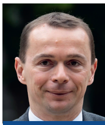
M. OLIVIER DUSSOPT Ministre du Travail, du Plein emploi et de l'Insertion

MINISTRE DU TRAVAIL, DU PLEIN EMPLOI ET DE L'INSERTION