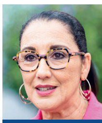
Mme FADILA KHATTABI Ministre déléguée chargée des Personnes handicapées

L'engagement du Gouvernement pour l'emploi des personnes handicapées, formulé lors de la 6 ème Conférence nationale du handicap, doit être mis en œuvre sans attendre. Grâce à la mobilisation forte de nos deux ministères, les mesures « emploi » de la CNH (Conseil National Handicap), formulées avec les associations et les personnes concernées, ont été transcrites dans le projet de loi pour le Plein emploi. Si le temps législatif peut parfois bloquer des changements urgents, ce texte, porté par le ministre du Travail Olivier Dussopt, permet une transcription rapide dans la loi d'avancées absolument majeures pour nos concitoyens en situation de handicap.