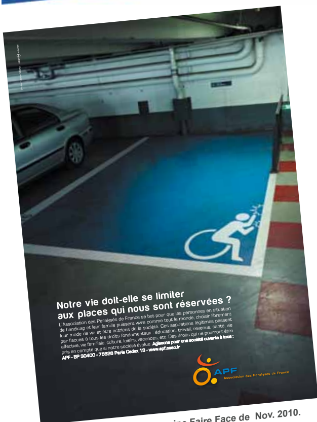
Extrait d'un article du magazine Faire Face de Nov. 2010.

Une place de stationnement libre, le rêve, surtout lorsqu'elle est réservée aux personnes handicapées. Seulement voilà, l'emplacement de parking adapté qui trône sur les affiches de la nouvelle campagne institutionnelle de l'APF ne semble pas faire l'affaire. En effet en bas de l'affiche, en état de révolte, le personnage du pictogramme «handicapé» s'anime et frappe fermement sur le cadre pour en sortir. En écho, le slogan interpelle sans détour l'observateur : « Notre vie doit-elle se limiter aux places qui nous sont réservées ? »